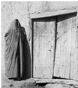
Женщина-мусульманка. Самарканд. С.М.Прокудин-Горский. Между 1905—1915 гг.