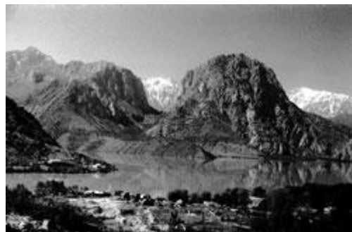
Озеро Искандер. Современное фото

В последующем — мне пришлось самому работать в этой камере, так как санитаров не было, а я был самым младшим. Для этого я раздевался донага, переходил чумную черту, забирал ишачьи сёдла и всякие иные, подлежавшие дезинфекции предметы, замазывал герметично вход, переходил на «здоровую» сторону, с ног до головы обтирался сулемой, одевался, пускал воду в