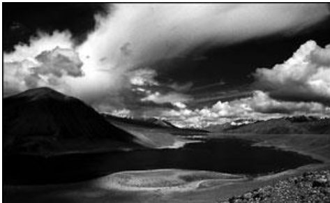
Озеро на Памире. Современное фото

— Я возьму вас с собой в Ливадию к государю императору.