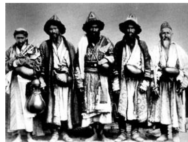
Дервиши. Фото начала XX в.

Средства были отпущены. Я провёл почти четырёхмесячную поездку, во время которой стал свидетелем Андижанского восстания 10 и объехал значительную часть бухарских владений. В Петербург я вернулся в конце сентября.