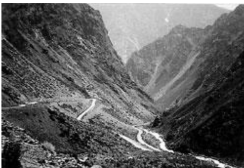
Озеро Искандер. Современное фото

Вторично «протекция» сказалась в 1900 г., когда Вуич, секретарь принцессы Ольденбургской, встретив меня на улице в весьма неблестящем, по скудости моих тогдашних финансов, одеянии и узнав, что я «безработный», предложил мне место письмоводителя в Обществе борьбы с заразными болезнями. Однако и это назначение не состоялось, так как нашёлся, очевидно, более приемлемый кандидат.