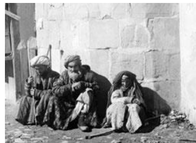
Нищие. Самарканд. С.М.Прокудин-Горский. Между 1905—1915 гг.